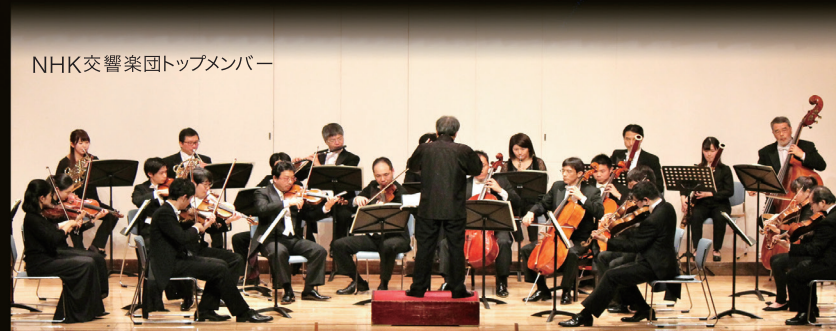
NHK交響楽団トップメンバー