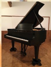
2016年、西方音楽館 木洩れ陽ホールに設置された ニューヨークスタインウェイB を用いてのコンサート